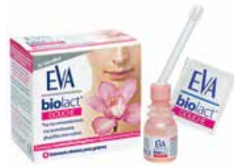
Irigator sa vaginalnim rastvorom za jednokratnu upotrebu